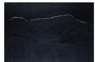
MÁS ALLÁ DEL LÍMITE, ACRILICO SOBRE TELA 100 X 110 CM, 2011