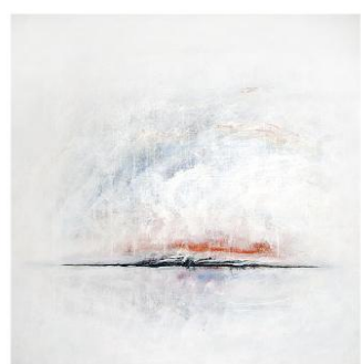
MÁS ALLÁ DEL LÍMITE, ACRILICO SOBRE TELA 100 X 110 CM, 2011