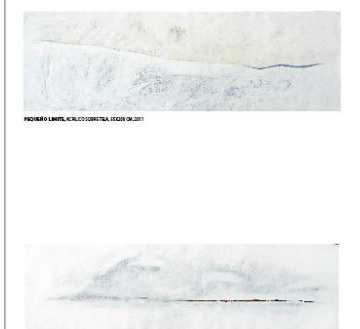
MÁS ALLÁ DEL LÍMITE, ACRILICO SOBRE TELA 100 X 110 CM, 2011