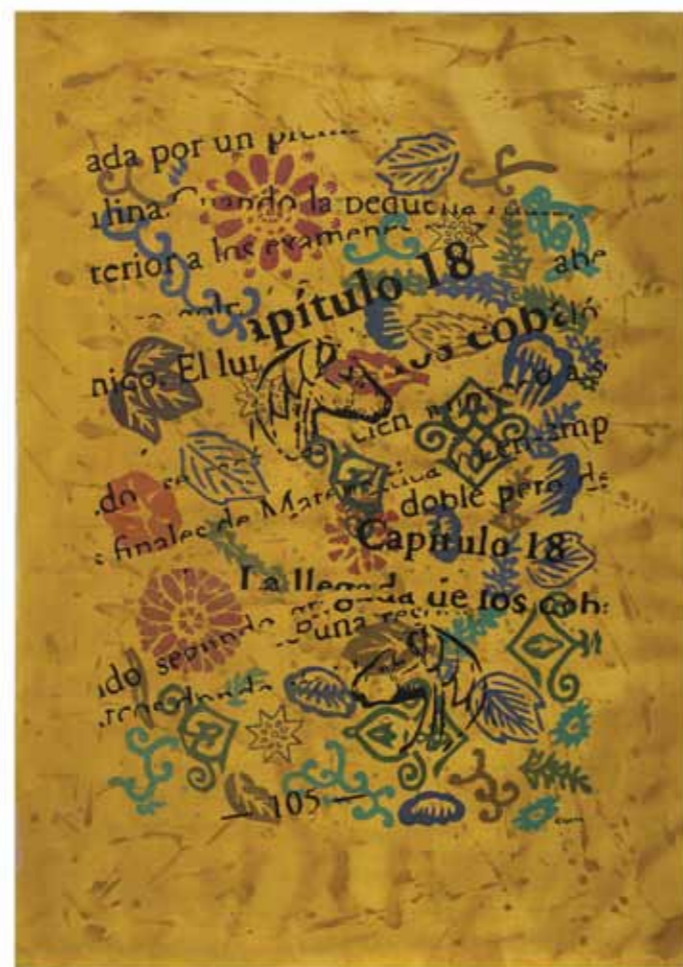
Transformaciones 10 Acrílico sobre tela 124 x 84 cm