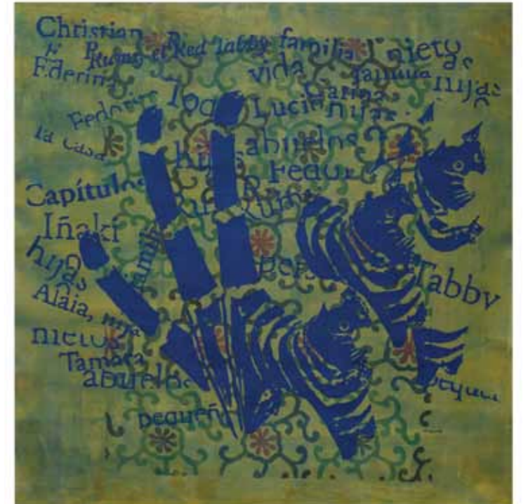
Transformaciones 6 Acrílico sobre tela 89 x 88 cm