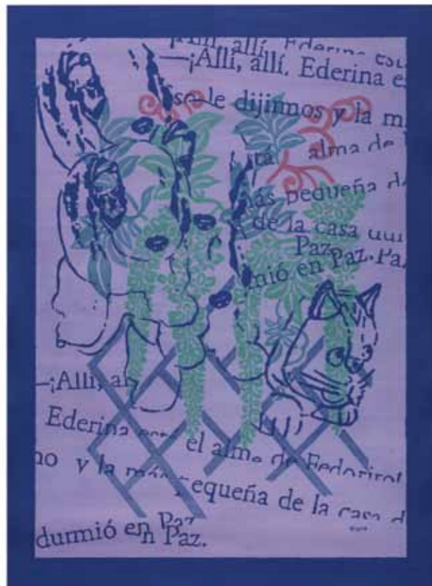
Transformaciones 7 Acrílico sobre tela 108 x 78 cm