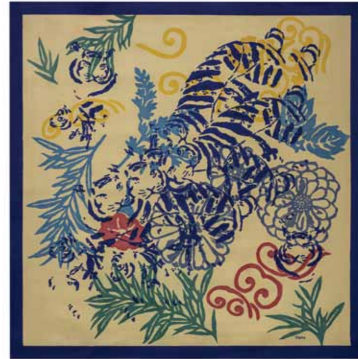
Transformaciones 5 Acrílico sobre tela 90 x 90 cm