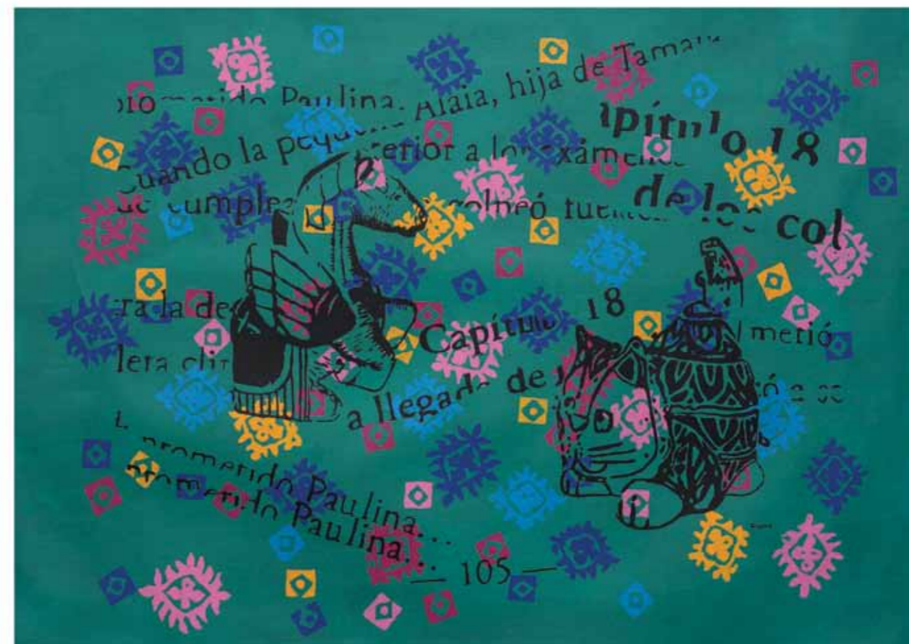
Transformaciones 11 Acrílico sobre tela 83 x 124 cm