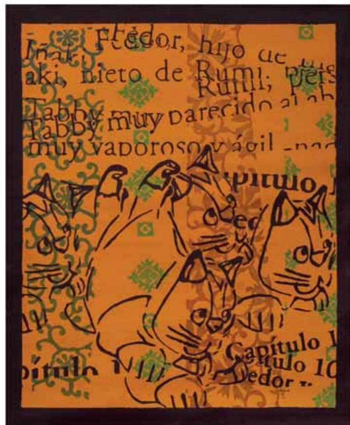
Transformaciones 1 Acrílico sobre tela 87 x 74 cm