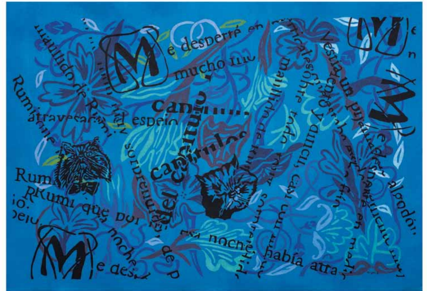
Transformaciones 2 Acrílico sobre tela 73 x 108 cm