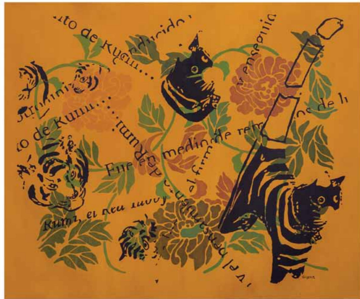
Transformaciones 3 Acrílico sobre tela 73 x 90 cm