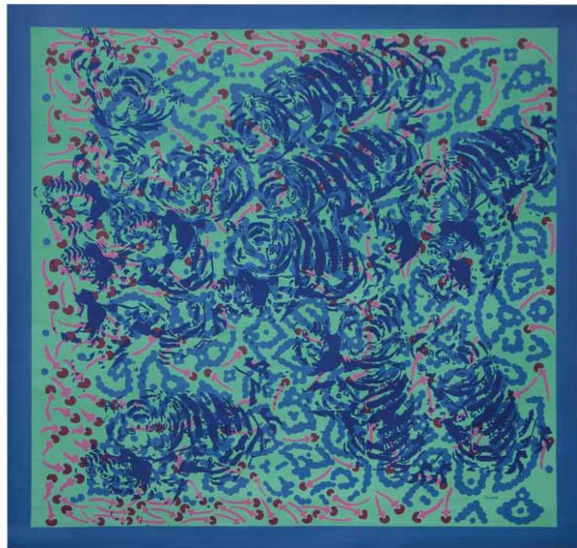
Transformaciones 12 Acrílico sobre tela 157 x 149 cm