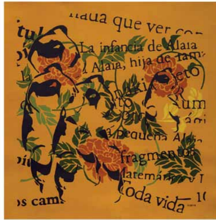
Transformaciones 8 Acrílico sobre tela 69 x 68 cm