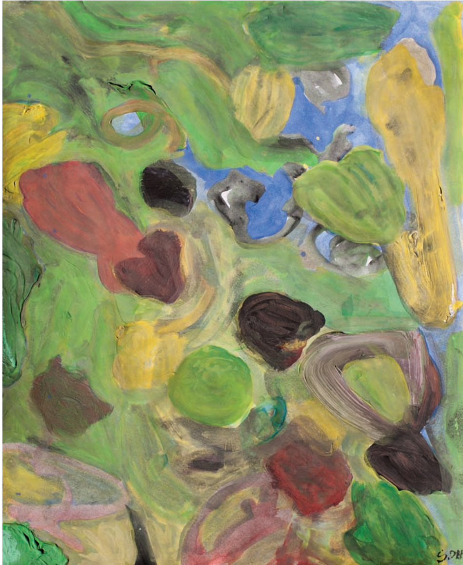
"BISCUIT" 2011 Oleo s/papel 27,5x35,5 CMS.