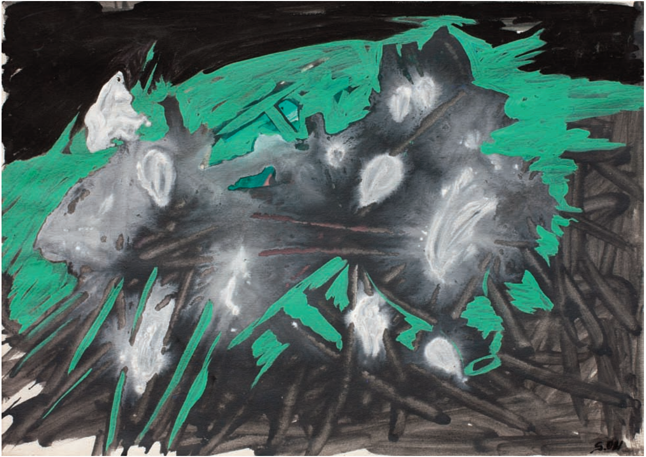
"ANIMAL NOCTURNO" 2011 Oleo s/papel 30x42 CMS.