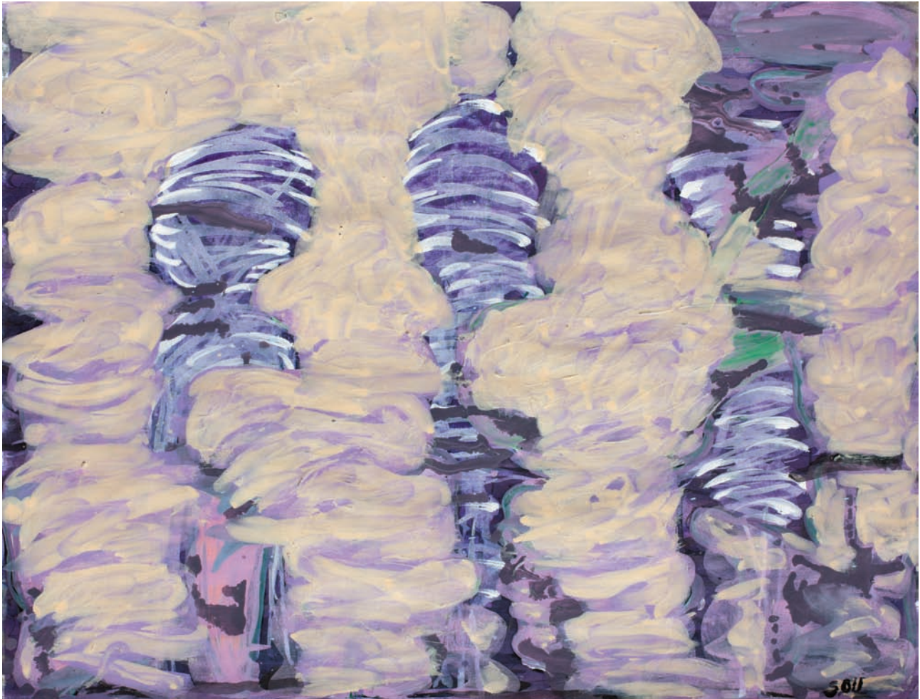
"STORM" 2011 Oleo s/papel 27,5x35,5 CMS.