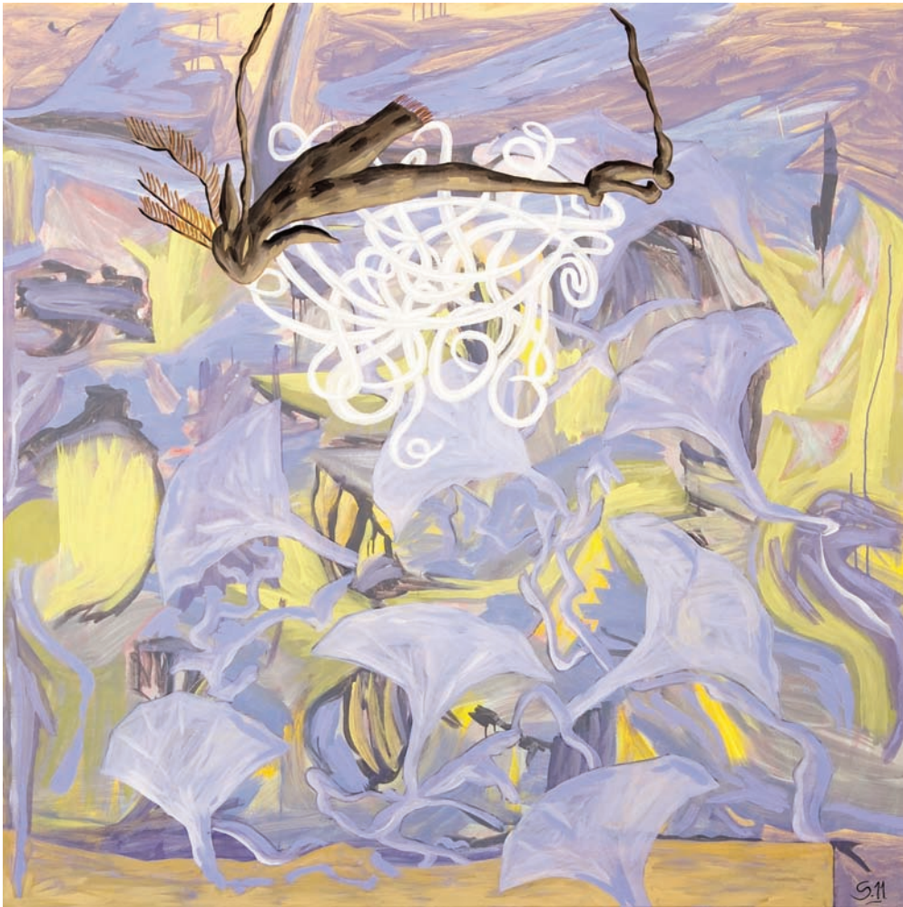
"LAMIA" 2011 Oleo s/tela 150x150 CMS.