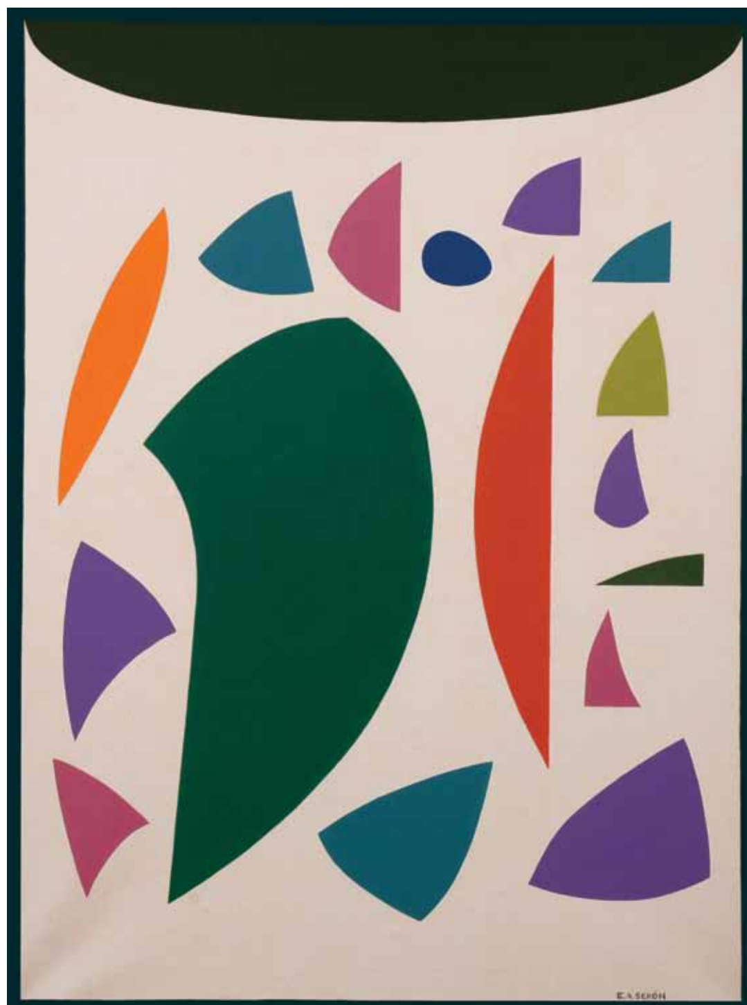
Algo que ocurre (2001) óleo sobre tela, 80 x 60 cm.