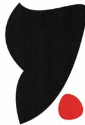
Eduardo Serón Ausstellung 4. Oktober - 16. November 2001 Generalkonsulat der Argentinischen Republik Mainzer Landstraße 46 / 19. Etage Frankfurt am Main Koramen Carin Plesky