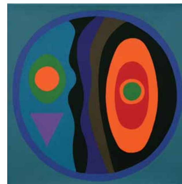
La libertad es redonda XIV (2011) óleo sobre tela, 40 x 40 cm.