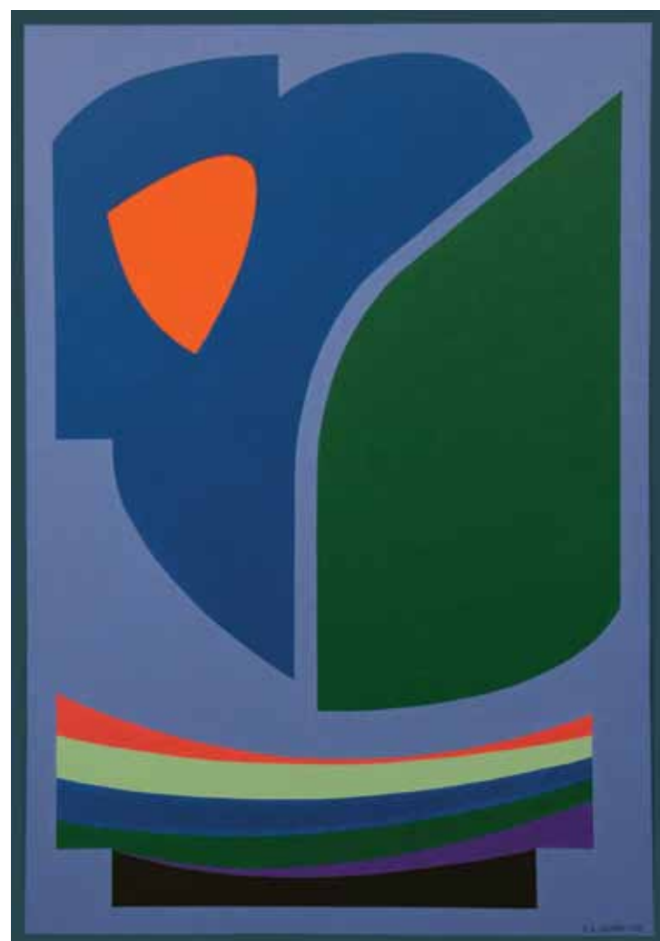
Iluminar como siempre el rostro de la verdad (2003) óleo sobre tela, 100 x 70 cm.