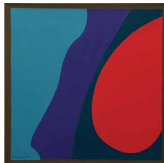
La tierra tiene un ritmo (2011) óleo sobre tela, 40 x 40 cm.