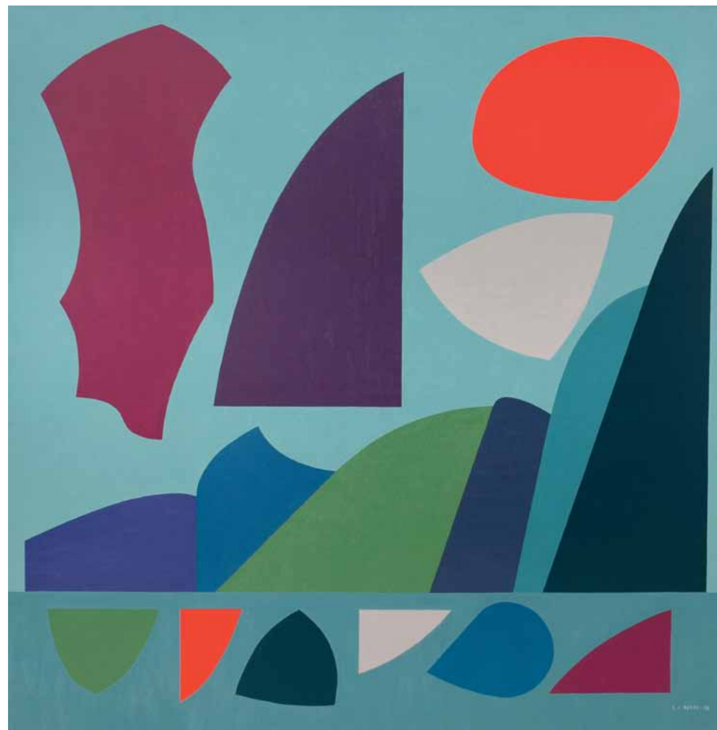
Huellas de una memoria (2005) óleo sobre tela, 150 x 150 cm.