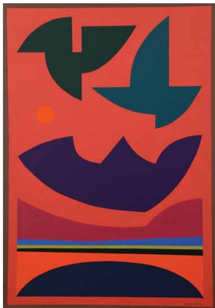
La mirada que asiente (2003) óleo sobre tela, 100 x 70 cm.