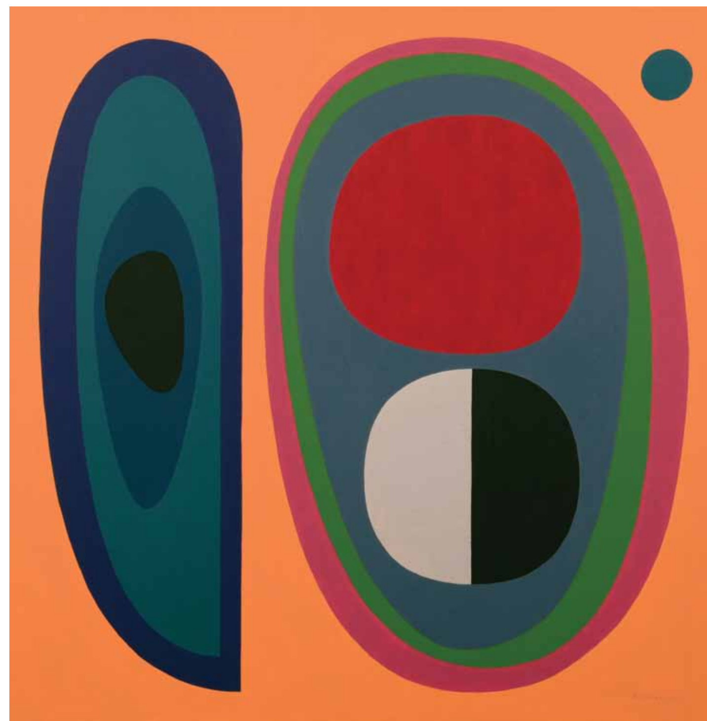
La libertad es redonda IV (2007) óleo sobre tela, 100 x 100 cm.